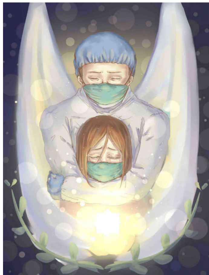
守护 2019级设计三班 王伟力