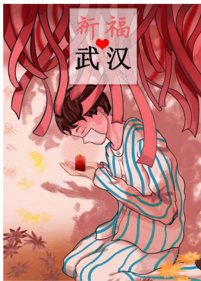
祈福 2018级视觉传达设计二班 谭阳光