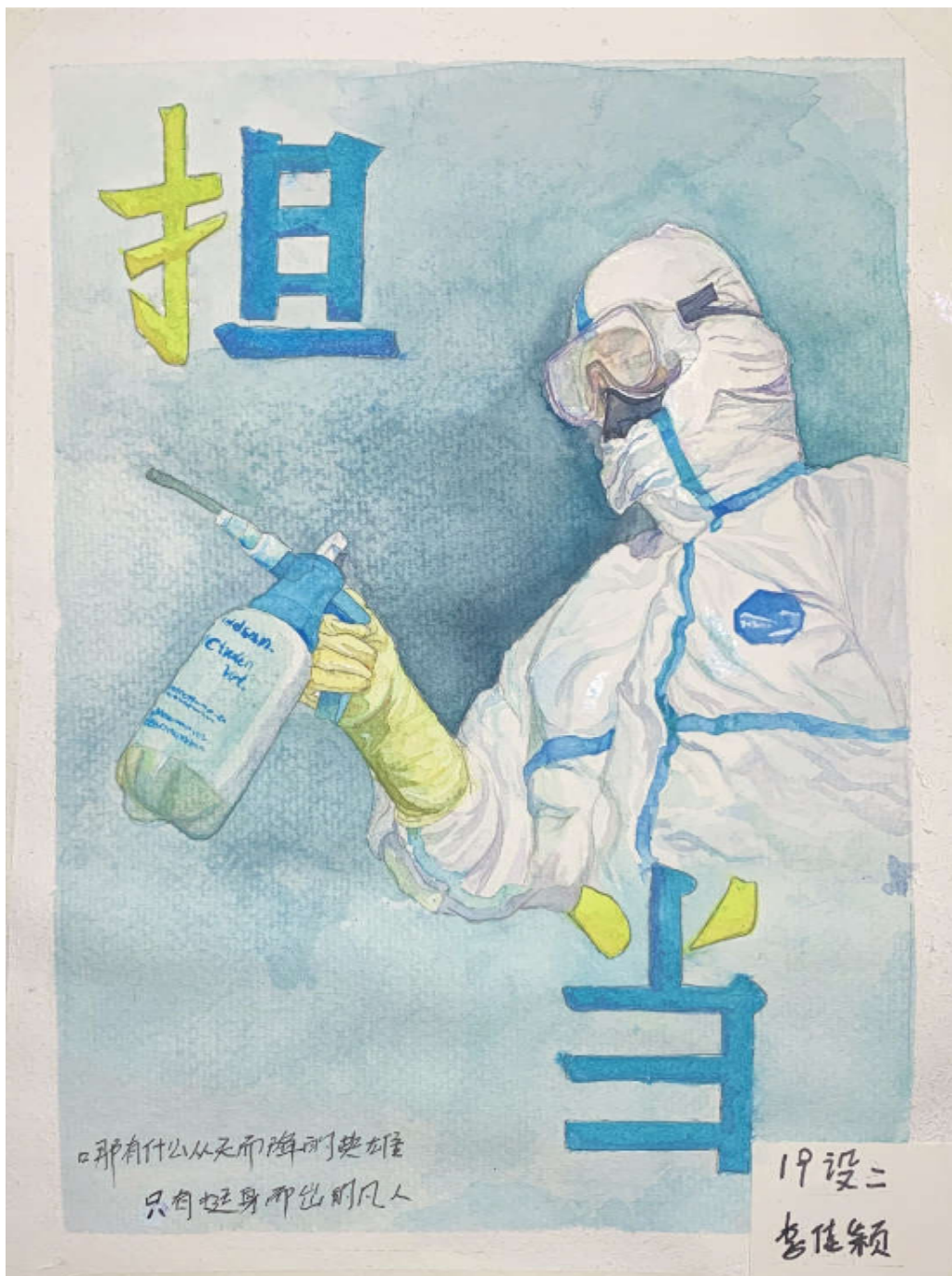
白衣战士 2019级设计二班 李佳颖